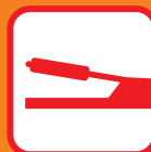
パーキングブレーキ