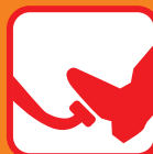
ブレーキのふみしろ