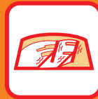
ワイパー・ウォッシャー